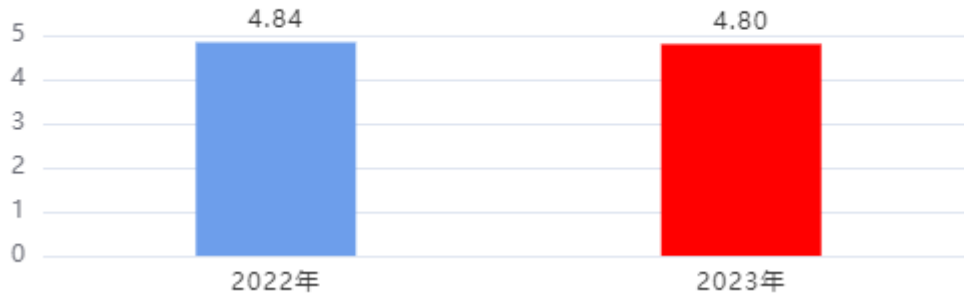
收入、支出决算总计对比图 (单位: 万元)